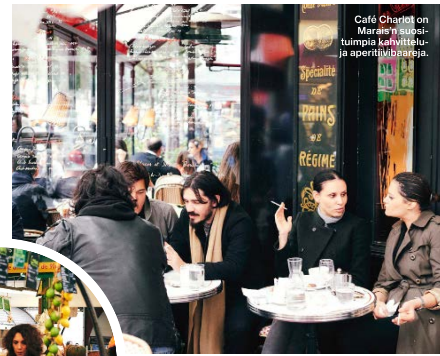
Café Charlot on Marais'n suosituimpia kahvittelu- ja aperitiivibaareja.