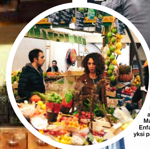
Pariisilaiset hankkivat mielellusti raaka-aineensa torilta. Marché des Enfants-Rouges on yksi parhaista.