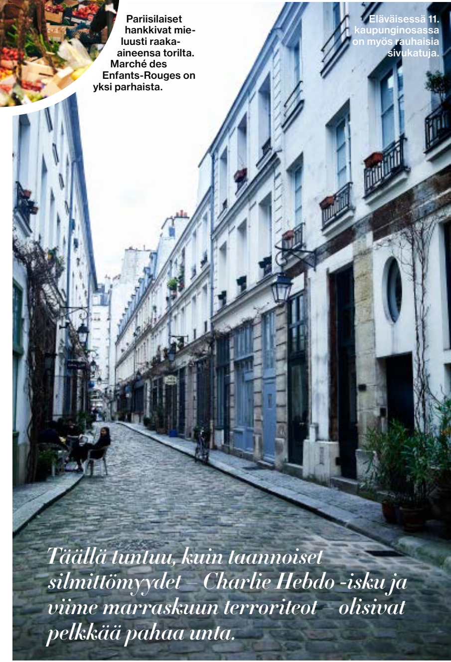
Eläväisessä 11. kaupunginosassa on myös rauhallisia sivukatuja.

Täällä tuntuu, kuin taannoiset silmittömyydet – Charlie Hebdo -isku ja viime marraskuun terroriteot – olisivat pelkkää pahaa unta.